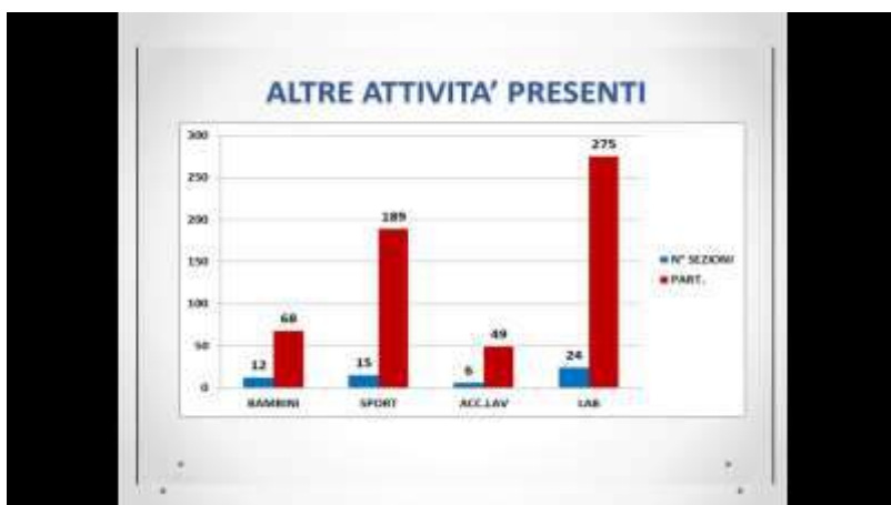
Numeri altri progetti e relativi partecipanti

Questo dato si riferisce alle attività di semiresidenzialità. In 11 realtà diverse 138 persone con sindrome di Down partecipano ad attività che si svolgono prevalentemente nei week-end. 9 sono i Centri Diurni nelle nostre sedi; i 127 partecipanti svolgono l'attività dal lunedì al venerdì.